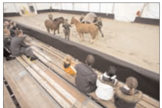
Un cours de répété' apprécié par la quinzaine de soldats du train cantonnés dans l'enceinte du Comptoir.

répétition «normal», ils travaillent souvent pour des communes ou des forestiers. «Nous portons du matériel dans les chalets d'alpage, nous débarquons des sentiers, nous réparons les dégâts de Lothar », éclaire Benoît Menoud, par ailleurs menuisier à Massonnens.