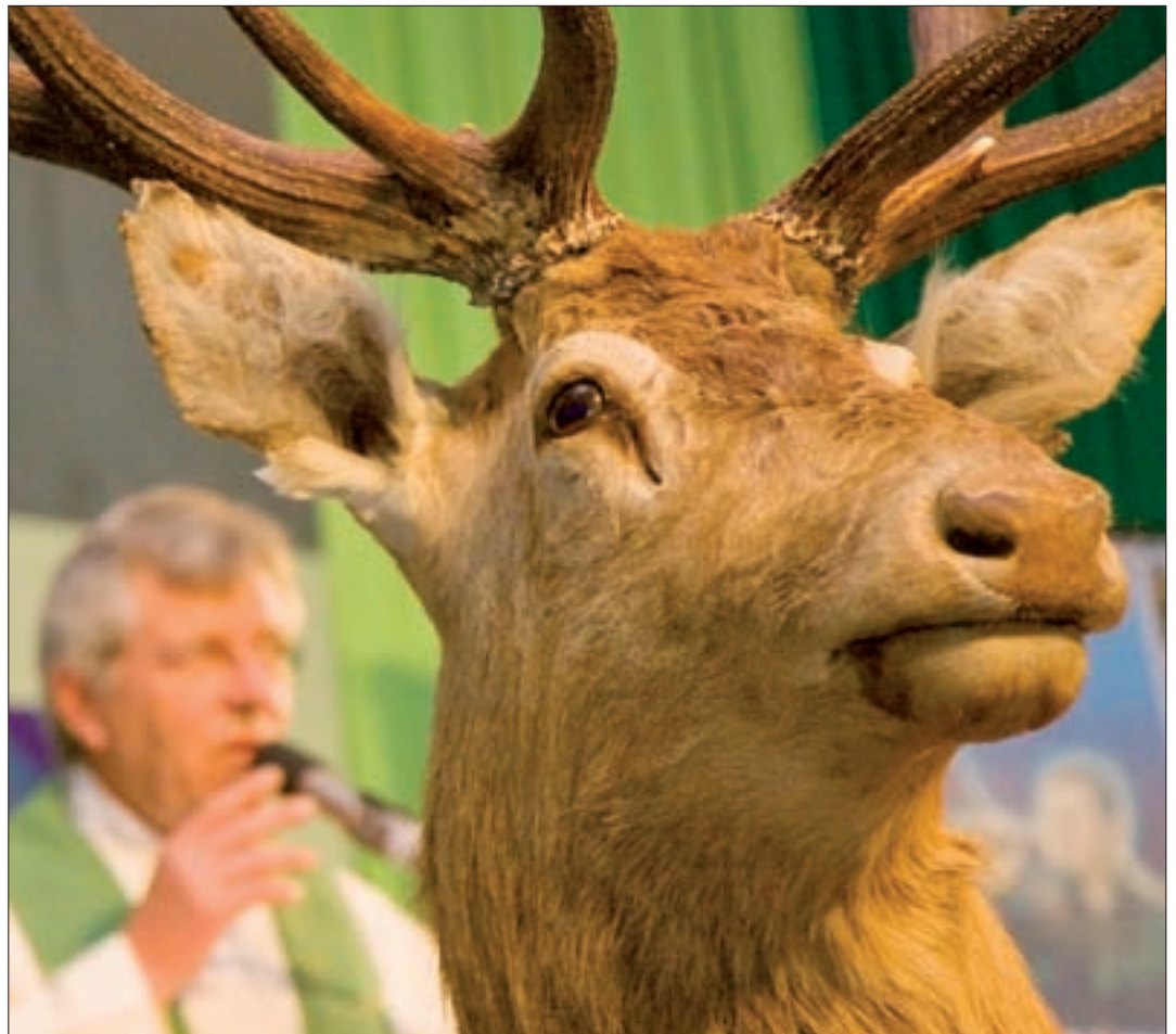
Prêtre et animal cohabitent lors de la messe de Saint-Hubert.

des forestiers, est une tradition qui se perpétue à la manifestation gruérienne. Elle était animée hier par les nemrods et les sonneurs de cors du Gibloux.